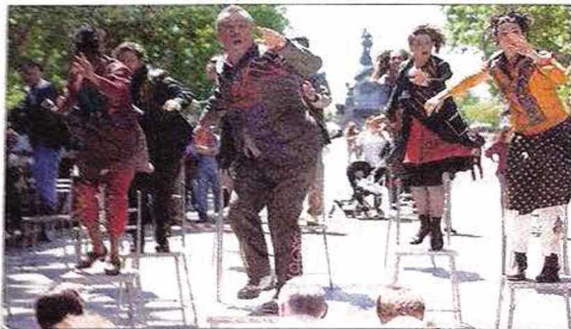
Compañía Oposito durante la representación de 'Kori Kori'. JOSÉ C. CASTILLO

zándose con el premio al Espectáculo más Original e Innovador por Hombres Bisagra , una propuesta escénica a medio camino entre representación teatral y concierto en el que gran protagonista es el movimiento del cuerpo.