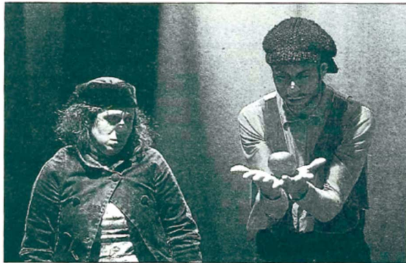
La obra también tiene momentos muy emocionantes.

sonas entre escenógrafos, encargados de efectos visuales, vestuario, música o diseño y luces. Además, los que se subirán a las tablas serán David Novell, Piero Partigianoni y Celia Ruiz, tres exalumnos de la escuela. Ellos serán, según Elisenda Belda, gestora de la compañía, «los encargados de trasladar al público el cuento de de tres amigos que, día tras día, se reúnen para jugar aunque no siempre es fácil ponerse de acuerdo y siempre hay peleas».