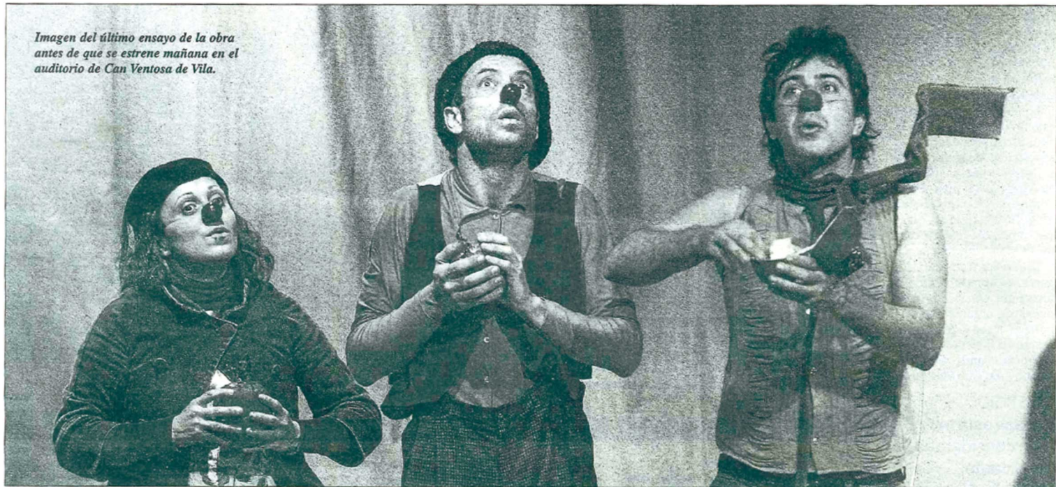
Imagen del último ensayo de la obra antes de que se estrene mañana en el auditorio de Can Ventosa de Vila.