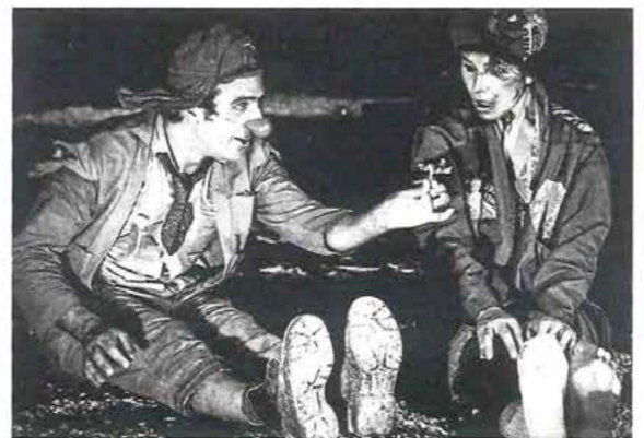
Los actores de 'Welcome', en una de sus actuaciones.