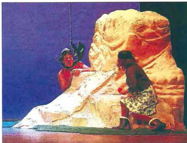
La obra narra las aventuras de tres amigos para ponerse de acuerdo.

En De piojos y manzanas participan trece personas entre escenó-