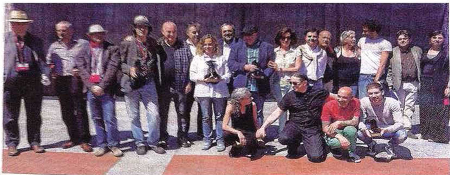
Los premiados en la decimosexta edición del TAC posan con los organizadores del certamen, ayer, en la Plaza Mayor. PABLO REQUEJO