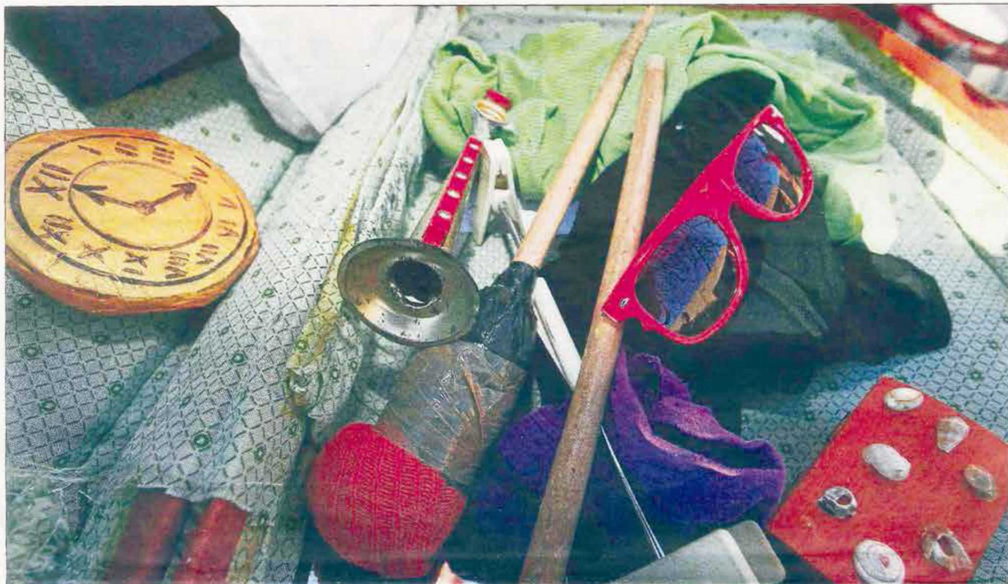
Relloques, miralls, la capsa dels nassos, ulleres i roba a una de les maletes en les que els clowns guarden vestuari i objectes.